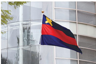
鮮やかな色彩が輝く塾旗 (矢上キャンパス)