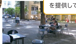
第一校舎前テーブルセット