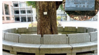
中庭大銀杏ベンチ